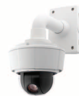
備註：安裝支架為分開販售